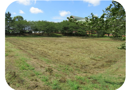
(草刈りをして頂いた未利用地)

くすのき荘の建物の南東になる未利用地(主目的は調節地)の有効活用を訴えました。市民の皆さんからはバードゴルフ・グランドゴルフ・駐車場としての要望の声をいただいています。