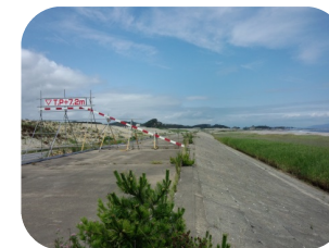
(建設中のスーパー堤防)