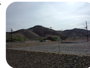
(復興のため山を切り崩す)